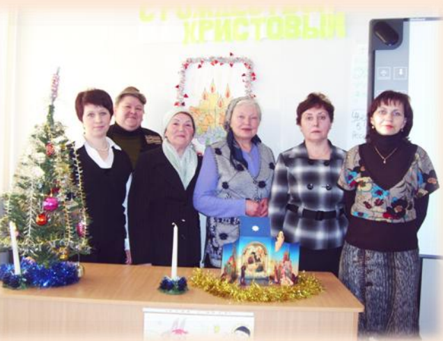
Приход Покрова Пресвятой Богородицы п.Баранчинский