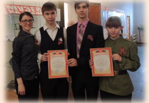
МОУ ДОД ДДТ г.Кушва