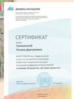
ГАОУ ДОД Свердловской области ЦДОД «Дворец молодёжи» г.Екатеринбург